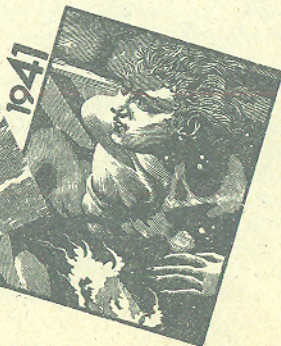
КОллаж: «АФИША СТМ»