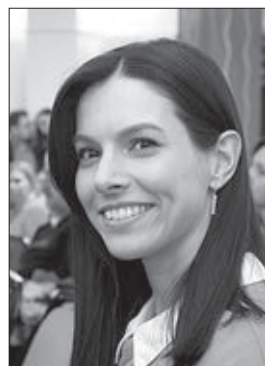
Журнал «The Most»

Партнерами конкурса «Акулы пера – 2022» выступили: группа компаний «Индор», Союз строителей Томской области, НО РАО «Росатом», «Томск РТС» Интер РАО, ООО «СЗ «Карьероуправление», ООО «Горсети», ОАО «ТДСК», ГК «Томльсдрев», АО «Томские мельницы», «Томскэнергосбыт», АО «Сибagro», УФСИН России по Томской области, АО «Сибирь», художественная школа № 1 Томска, газета «Томские новости».