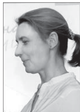
Газета «Общественное самоуправление»