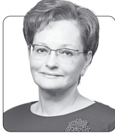
Оксана Козловская, председатель Законодательной думы Томской области