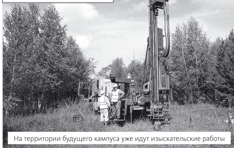
На территории будущего кампуса уже идут изыскательские работы

Президент России Владимир Путин поручил создать в стране к 2030 году 25 кампусов мирового уровня. Среди них – томский межвузовский кампус. Объект будет построен на участке Заварзино-Радиостанция № 1,2 рядом с особой экономической зоной. Этот выбор поддержан правительством РФ. В начале августа здесь стартовали инженерные изыскания. На сентябрь запланировано подписание концессионного соглашения с инвестором. Строительство планируется завершить в третьем квартале 2027 года.