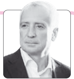
Владимир Мазур, губернатор Томской области

Желаем строительным компаниям нашей области новых масштабных проектов и экономической устойчивости, а трудовым коллективам – достатка в семьях, счастья и крепкого здоровья!