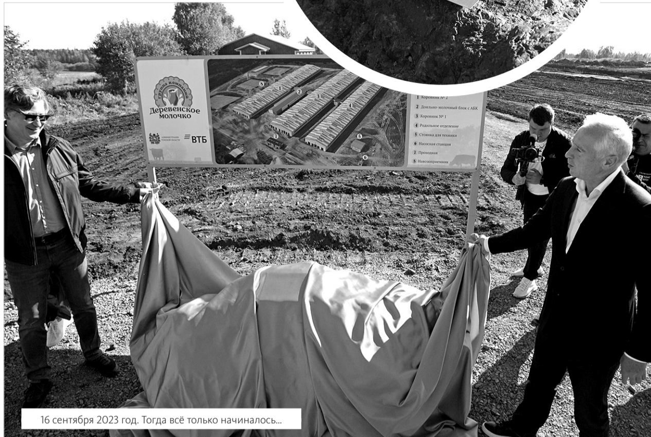
16 сентября 2023 год. Тогда всё только начиналось...