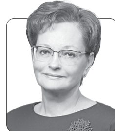
Оксана Козловская, председатель Законодательной думы Томской области