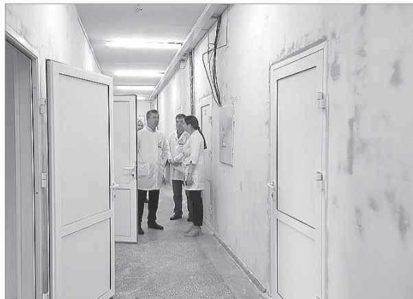
■ ДО РЕМОНТА