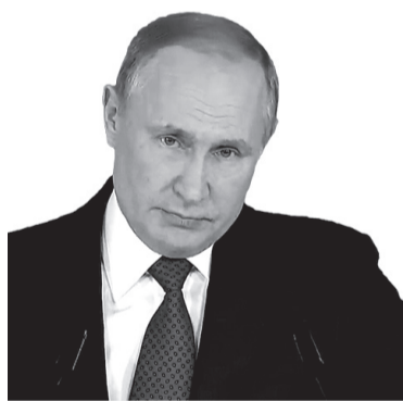
Владимир Путин, президент Российской Федерации на форуме в Петербурге

“ Российские регионы – новая география развития, создание точек роста в городах, посёлках по всей территории страны, возможность для людей там приобрести профессию, найти хорошо оплачиваемую работу или вести своё дело, реализовать себя, жить, воспитывать детей в комфортных современных условиях.