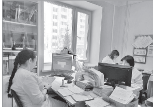
■ ПОСЛЕ РЕМОНТА