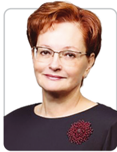
Оксана Козловская, председатель Законодательной думы Томской области