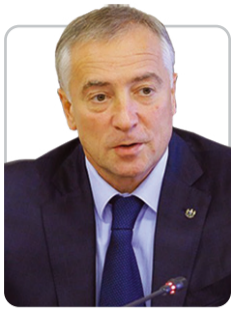
Владимир Мазур, губернатор Томской области