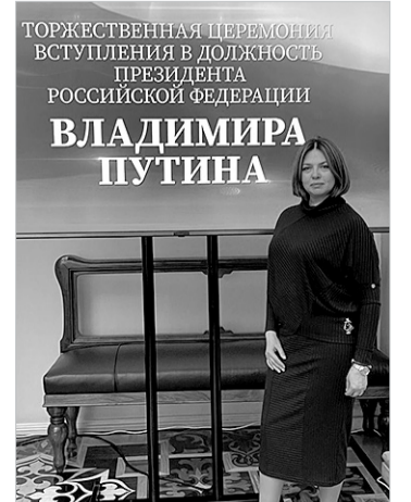
ТОРЖЕСТВЕННАЯ ЦЕРЕМОНИЯ ВСТУПЛЕНИЯ В ДОЛЖНОСТЬ ПРЕЗИДЕНТА РОССИЙСКОЙ ФЕДЕРАЦИИ ВЛАДИМИРА ПУТИНА

– Сегодняшнее событие – событие мирового масштаба. Это начало нового пути развития страны, но это и запятая в череде серьезных дел и достижений России. Впереди у нас много работы. Но я полностью согласна со словами президента, которыми он завершил своё выступление на церемонии вступления в должность руководителя страны: «...Мы единый и великий народ и вместе преодолеем все преграды, воплотим в жизнь всё задуманное. Вместе победим!»