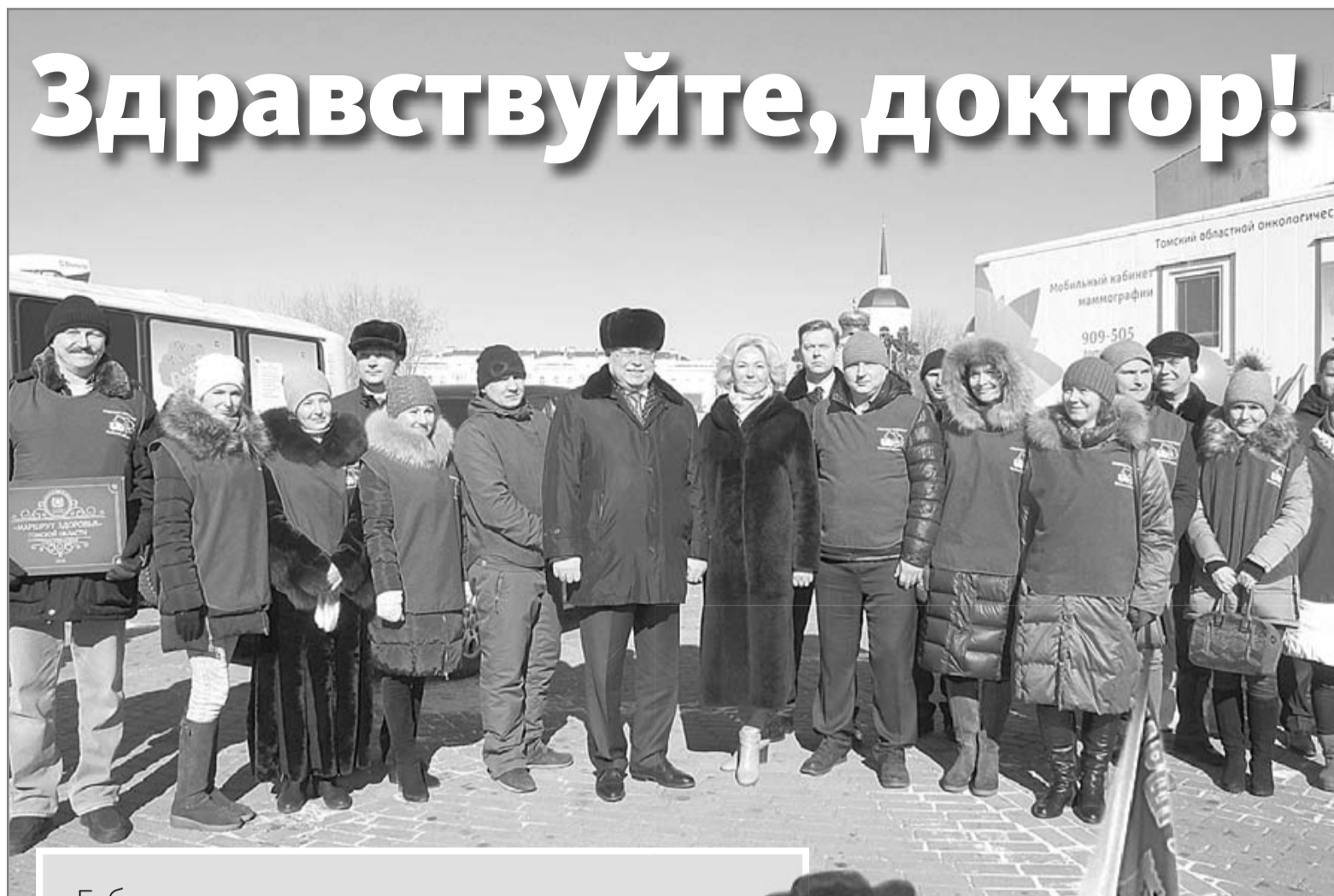
Губернатор и замминистра здравоохранения отправили «Маршрут здоровья» в новый рейс

В этом году «Маршрут» пройдет через восемь муниципалитетов Томской области. Это Асиновский, Томский, Кривошеинский, Колпашевский, Шегарский, Первомайский, Паравельский районы и город Кедровый. В состав автоколонны вошли флюорографический и маммографический передвижные медицинские комплексы, мобильный центр здоровья, машина Территориального центра медицины катастроф, автобус с интерактивной выставкой, посвященной здоровому образу жизни. Шесть транспортных средств оборудованы всем