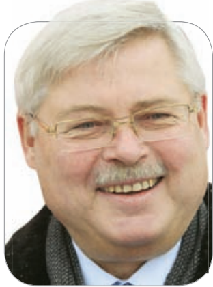
Сергей Жвачкин, губернатор