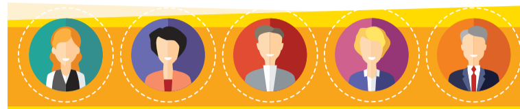
Бухгалтерия и кадры | Бухгалтерия и кадры бюджетной организации | Юрист | Кадры | Специалист по закупкам