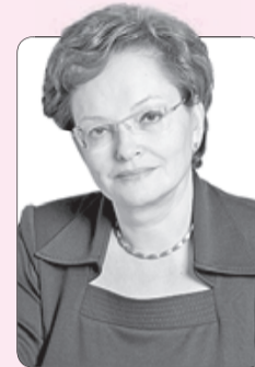
Оксана Козловская, председатель Законодательной думы Томской области