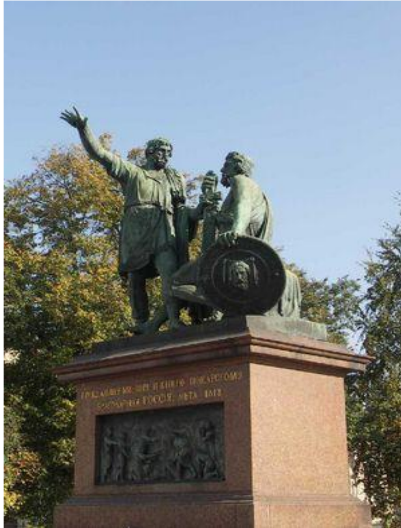
Памятник Минину и Пожарскому, 1818 Скульптор И. П. Мартос (Бронза, литье. Высота: 8,8 м.)

Памятник Минину и Пожарскому - скульптурная группа из бронзы, созданная Иваном Мартосом; расположена перед Собором Василия Блаженного на Красной площади. Первый памятник в Москве. Посвящён Кузьме Минину и Дмитрию Михайловичу Пожарскому, одним из руководителей народного ополчения во время польской интервенции в Смутное время, и победе над Польшей в 1612 году.